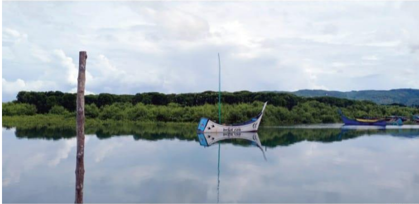
in Bakau di Lambada merupakan hutan yang telah ada pasca Tsunami 2004 silam.