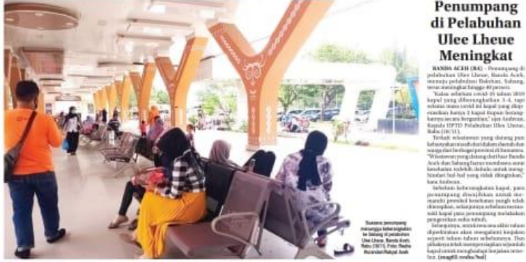
Sejumlah peserta mengikuti pelatihan BST...