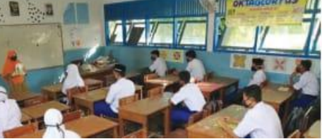
Beberapa siswa di dalam kelas...