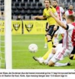
Dibantai 0-13 oleh Ajax, Pelatih VVV Venlo: Kepala Kami Tetap Tegak

AMSTERDAM (RA) - Apa kerendahan hati sebagai pelatih yang kalah dengan Ajax 0-13? Pelatih VVV Venlo mengatakan bahwa kepala mereka tetap tegak. "Saya merasa anah sebagai pemain di klub ini. Saya merasa aneh sebagai pemain di klub ini. Saya merasa aneh sebagai pemain di klub ini. Saya merasa aneh sebagai pemain di klub ini." "Saya merasa anah sebagai pemain di klub ini. Saya merasa aneh sebagai pemain di klub ini. Saya merasa aneh sebagai pemain di klub ini. Saya merasa aneh sebagai pemain di klub ini." "Saya merasa anah sebagai pemain di klub ini. Saya merasa aneh sebagai pemain di klub ini. Saya merasa aneh sebagai pemain di klub ini. Saya merasa aneh sebagai pemain di klub ini."