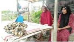
Beberapa anak-anak peserta...