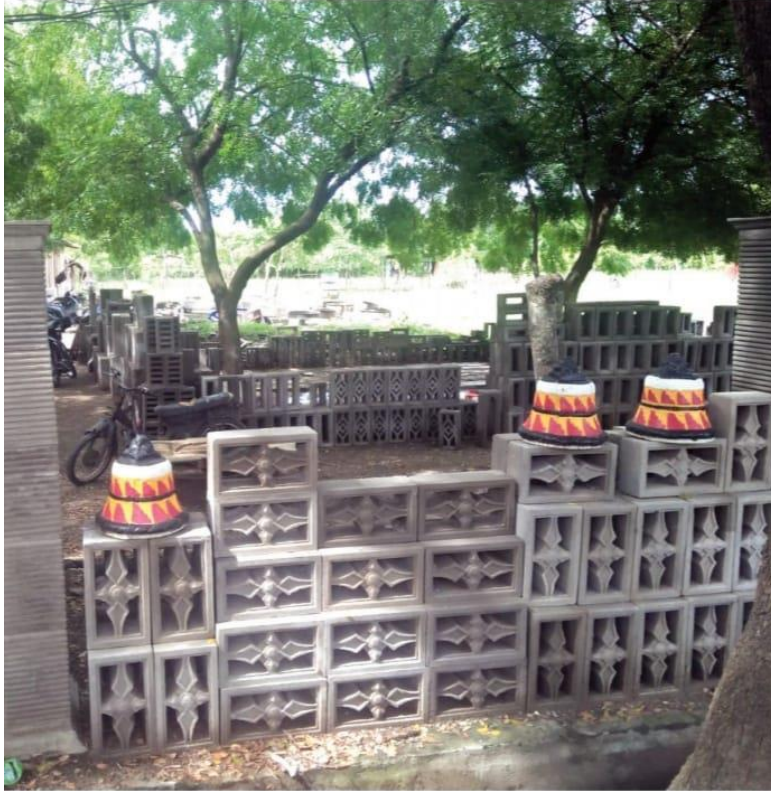
It loster (luang angin rumah), di Kajhu, permintaan semakin menurun dibandingkan dua tahun lalu.